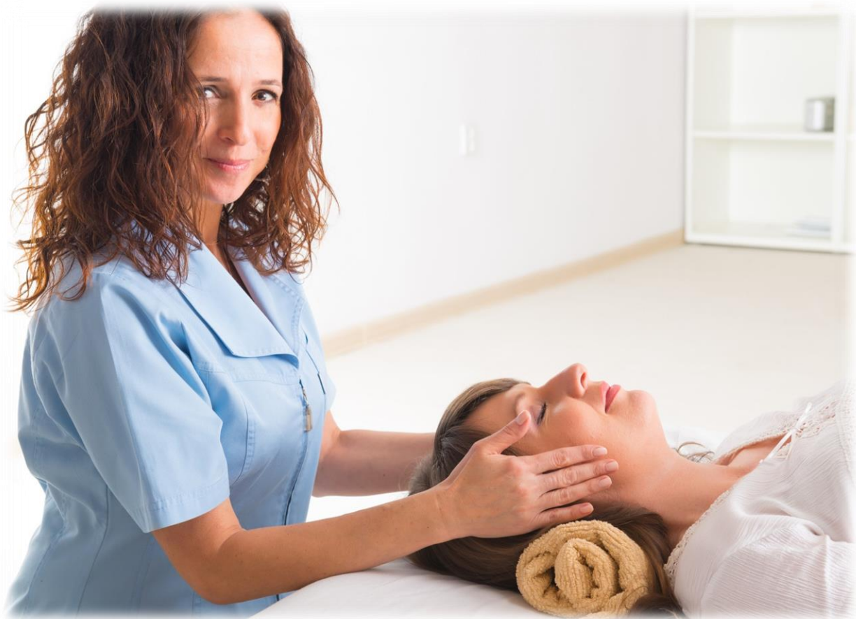
Figura professionale con possibilità di iscrizione ai registri di categoria professionale di SIAF ITALIA e AICS secondo la normativa vigente e la legge 4/2013. Il percorso di formazione consente di diventare “Operatore del Benessere Psicofisico” come definito nella norma UNI 11713 (Ente Nazionale di Normazione) del 31/05/2018 con possibilità di certificazione.

L'Operatore Olistico è un professionista interdisciplinare che supporta le persone nel ritrovare l'armonia psicofisica con metodologie olistiche e bionaturali.